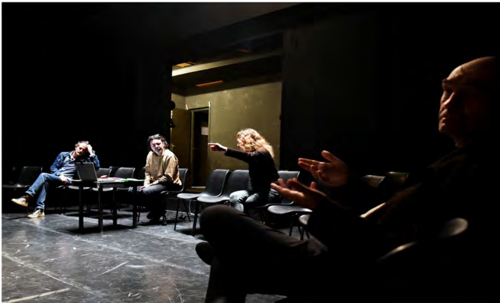
Répétition / Discussion / octobre 2025